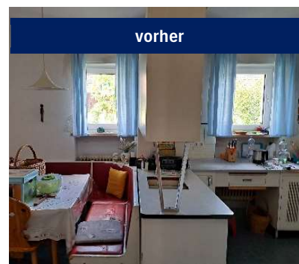
Gemütlich, war aber etwas in die Jahre gekommen: Jetzt erstrahlt die Küche in neuem Glanz