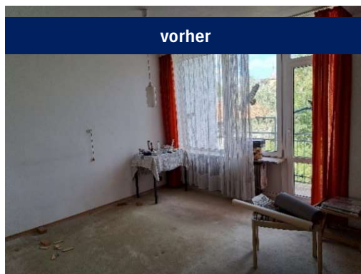
Das Zimmer ist bereit für ein neues Outfit